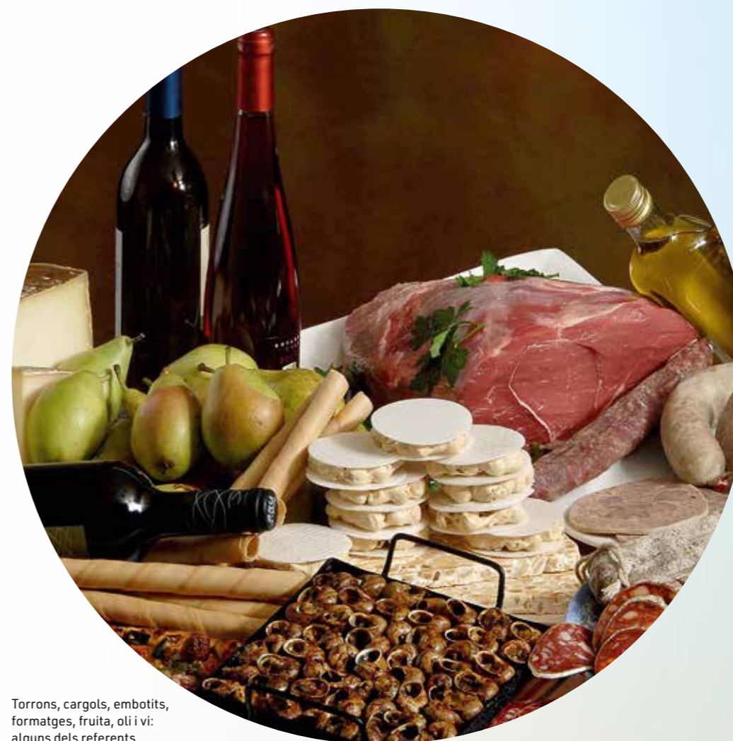
Torrans, cargols, embotits, formatges, fruita, oli i vi: alguns dels referents gastronòmics lleidatans.

La senyalització del Camí Ignasià a Catalunya és direccional, amb sols i fletxes de color taronja.