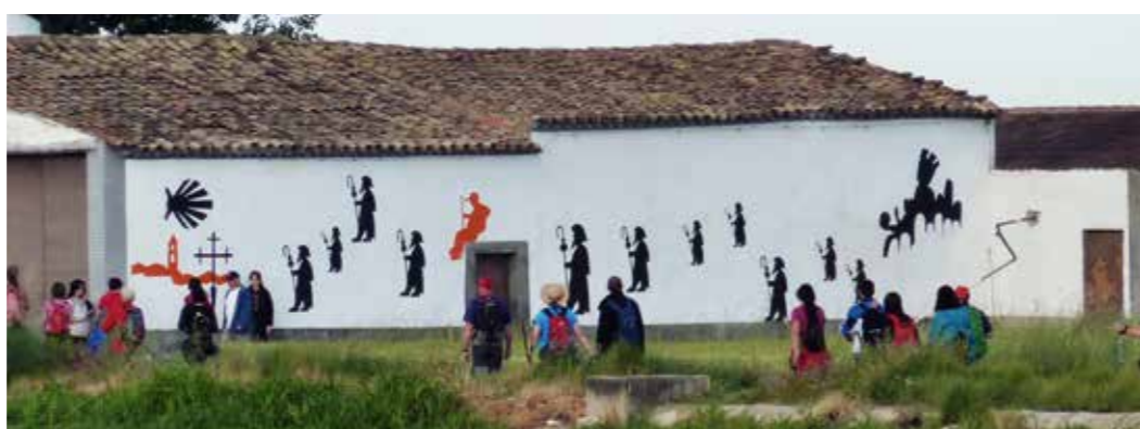
Pelegrinatge i art mural s'integren al Palau d'Anglesola (el Pla d'Urgell), on hi ha l'Associació l'Hospiteler que acull als pelegrins.

El Camí Ignasià està pensat per fer-lo en 27 jornades recreant l'itinerari que el cavaller va seguir al segle XVI. Surt de terres basques i passa per La Rioja, Navarra i Aragó abans d'entrar a Lleida. Curiosament, quan Sant Ignasi va recórrer aquells camins (els mateixos que els actuals), segurament es va creuar amb un munt de pelegrins que anaven a Santiago de Compostel·la, però ell anava 'a la contra', o sigui, en direcció oposada. De ben segur que no és tota l'estona, però sí que és cert que el Camí Ignasià coincideix un munt de quilòmetres amb el de Sant Jaume... tot i que es facin en un altre sentit per arribar a Manresa.