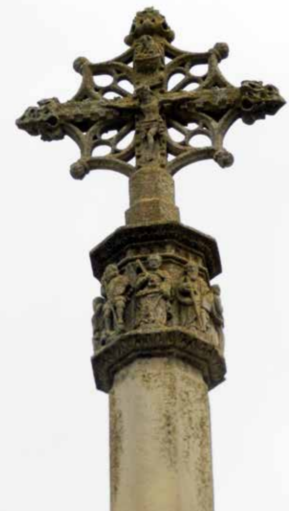
La creu de terme d'Anglesola, a l'Urgell.