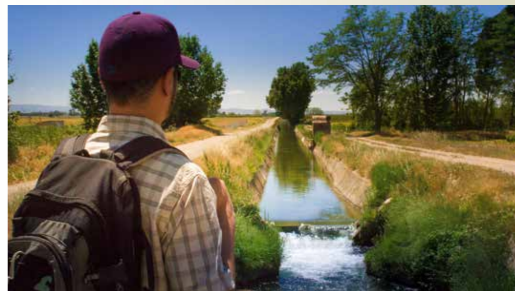
Els canals d'Urgell acompanyen i refresquen el pelegrí en alguns trams de la plana de Lleida.

Si és el primer cop és habitual fer-ho acompanyat... llevat que un estigui ja molt acostumat a caminar. La majoria dels pelegrins que van sols són 'repetidors'.