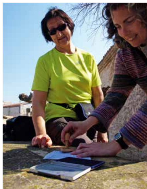
Signant la credencial a Pallerols (la Segarra).

Segons aquests exercicis espirituals, la quarta setmana es correspon a la resurrecció. És a dir, a la crida per a un nou començament. Les fèrtils terres lleidatanes acompanyen com un guant aquesta etapa després de la solitud dels Monegres.