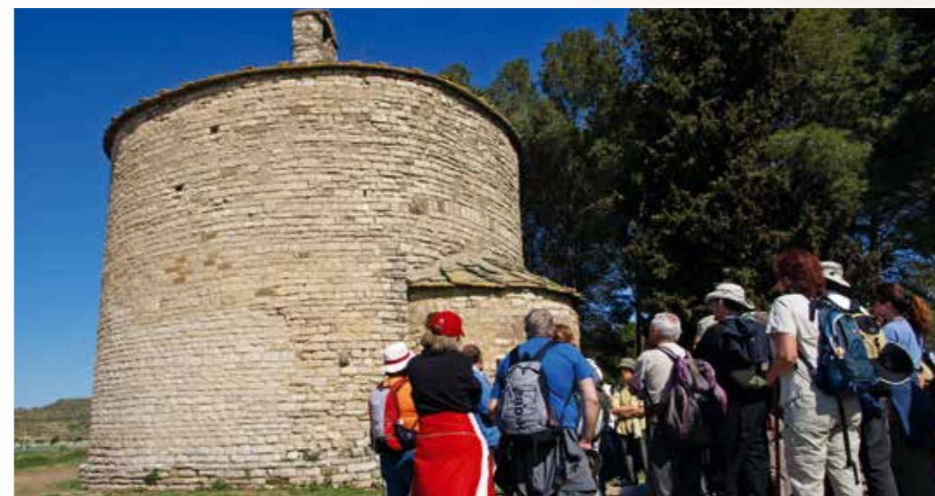
Una aturada a l'església romànica de Sant Pere el Gros, a Cervera (la Segarra).