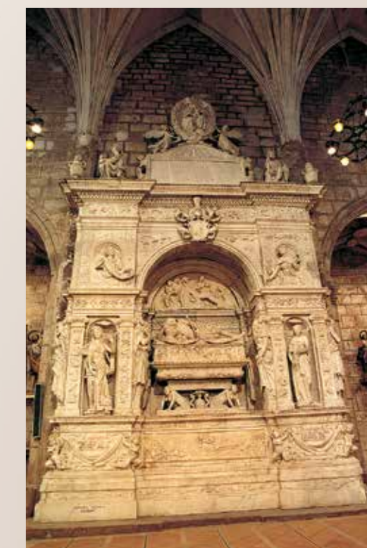
El mausoleu renaixentista de Ramon Folch i Cardona, a Bellpuig (l'Urgell).