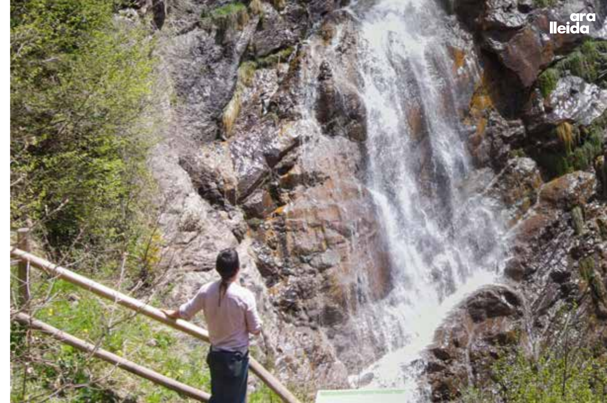
La cascada El Salto, a Senet, fita del Camí de Sant Jaume a l'Alta Ribagorça, que va a petar a Lleida per enllaçar amb l'altre Camí Català.

Aquest estiu s'ha senyalitzat un nou tram de camí. Es tracta del que discorre entre Saint Bertrand de Cominges i Berbegal. Aquest itinerari de 238 km en té 61 que passen per terres lleidatanes, concretament per les comarques de la Val d'Aran i l'Alta Ribagorça. La 'Via Aran-Pirineus' segueix la tradicional ruta jacobea que es dirigia cap a Santiago de Compostel·la passant per Vielha i Roda d'Isàvena, que va cobrar importància durant l'Edat Mitjana, sobretot arran de les guerres religioses entre hugonots i catòlics que provocaren que el pas de Somport fos poc segur.