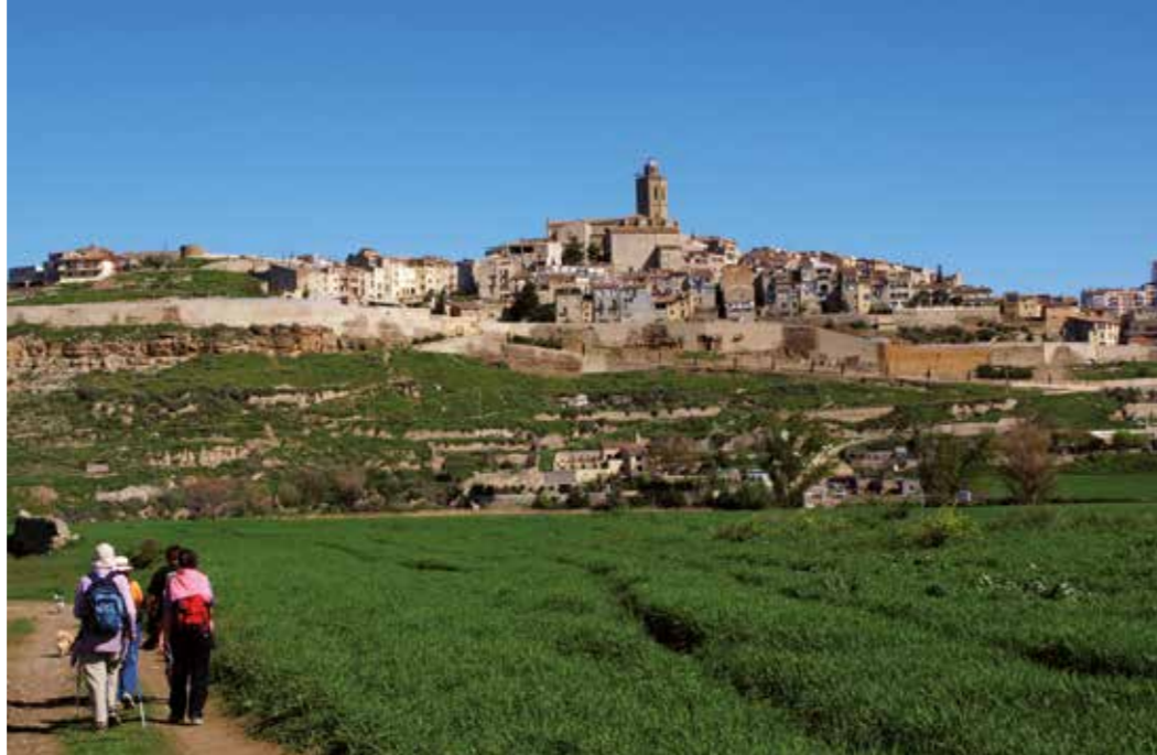
Cervera s'obre al pelegrí amb un ric patrimoni monumental: la Paeria (amb les originals mènsules medievals), la muralla, el carreró de les Bruixes, l'església de Santa Maria, la Universitat...

Aquest recorregut té l'al·licient de visitar els 3 monestirs cistercencs situats a Poblet, Santes Creus i Vallbona de les Monges. Així, quan entra en terres lleidatanes, creua l'Urgell, el Pla d'Urgell, les Garrigues i el Segrià. Ja fa més d'una dècada que aquest tram està completament senyalitzat. Quan discorre per Lleida, ho fa en les etapes de Vallbona de les Monges a Juneda, i d'aquí a Lleida per enllaçar amb el camí principal que va cap a Saragossa.