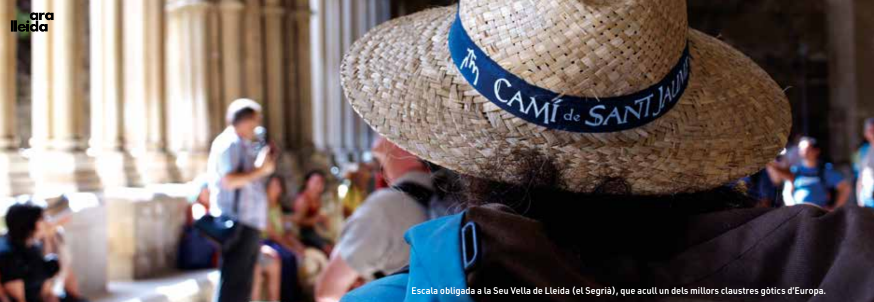
Escala obligada a la Seu Vella de Lleida (el Segrià), que acull un dels millors claustres gòtics d'Europa.