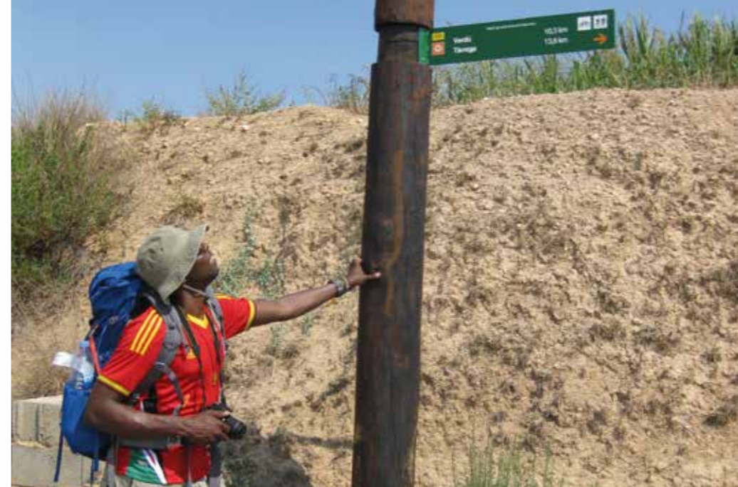
Pelegrins d'arreu del món recorren el Camí Ignasià.

L'estada a Verdú es pot complementar amb la visita al centre històric, al castell medieval (seu de l'oficina de turisme), a l'església de Santa Maria, als reputats tallers de ceràmica o als diversos cellers del municipi, que celebra una popular Festa del Vi i la Verema cada mes d'octubre. Turisme de Verdú organitza (sempre sota demanda) visites guiades al poble, que inclouen precisament el santuari de Sant Pere Claver.