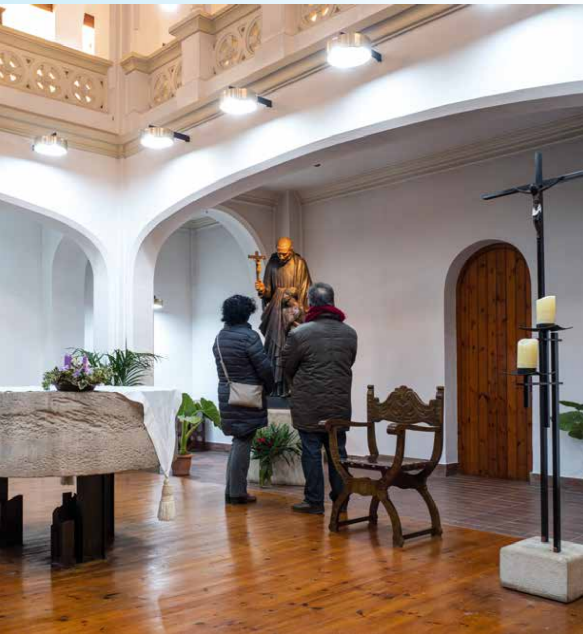
Diverses imatges del santuari de Sant Pere Claver a Verdú, on es guarda una costella del sant exposada en un bonic reliquiari.