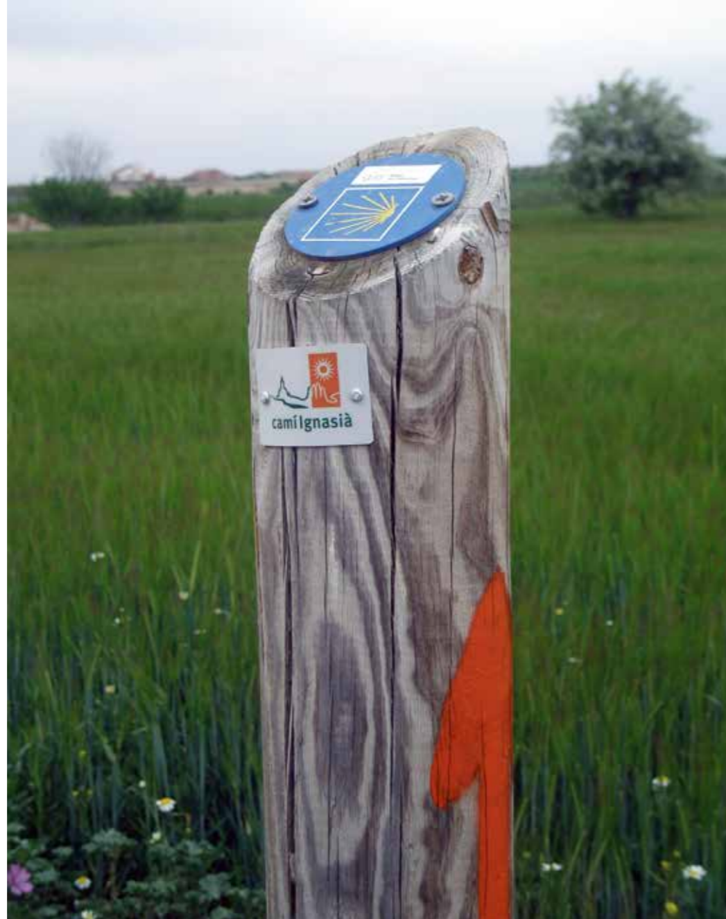
Senyalització del Camí Ignasià, també dit camí del Sol, al seu pas per l'Urgell.

Les Terres de Lleida han estat des de sempre encreuament de camins, comunicacions i vies de transport per a persones i mercaderies. Prova d'això és que entre les seves muntanyes i planes han discorregut des de fa centúries, a més dels coneguts traçats comercials, rutes de peregrinació. I no en parlem d'una sola, sinó que veurem com l'excusa per redescobrir-se un mateix té a Lleida diverses opcions. D'una banda hi ha el Camí de Sant Jaume (on tenim 4 rutes ja marcades... i una subruta que probablement es començarà a treballar més endavant) i el Camí Ignasià que uneix la ciutat