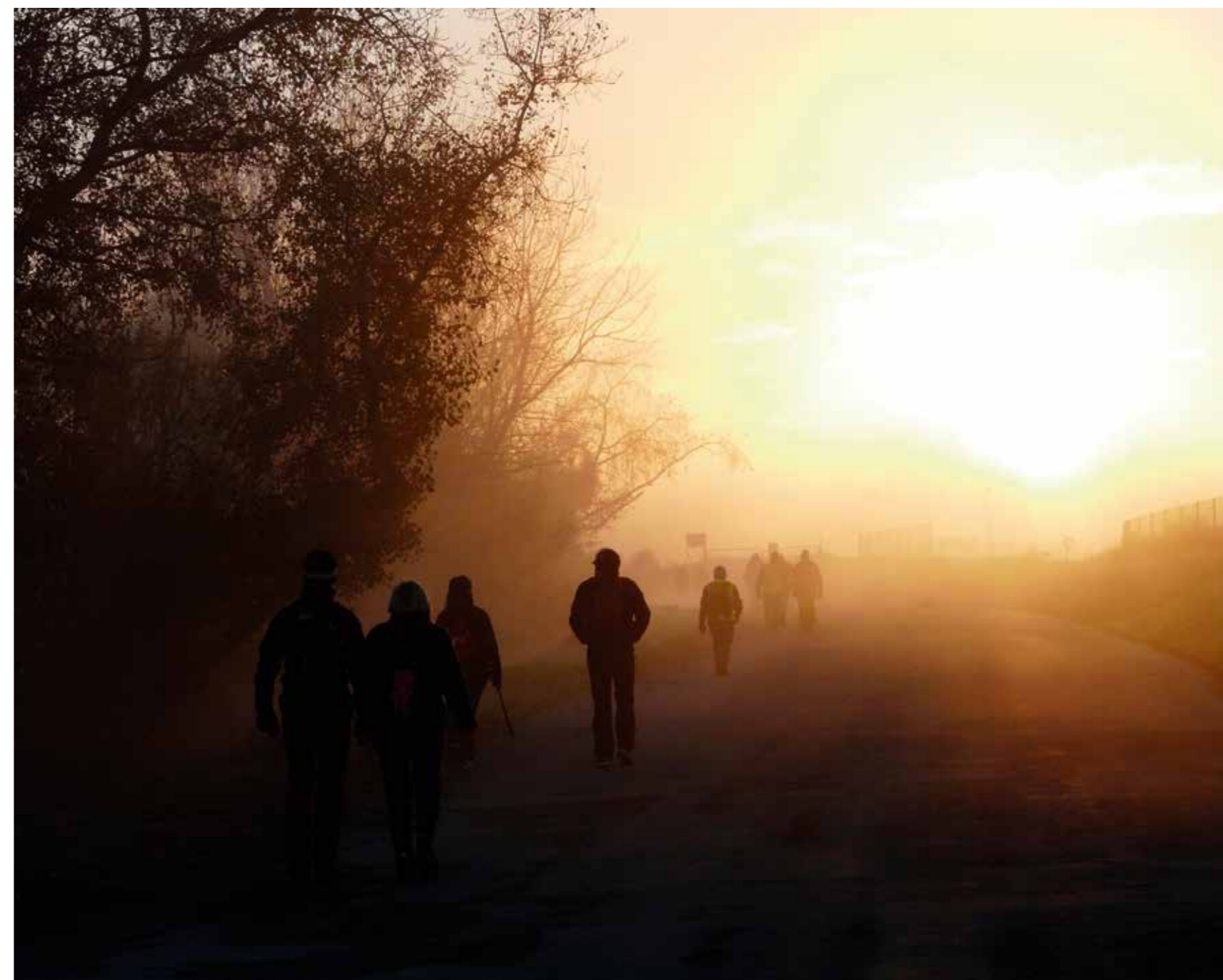
Enigmàtica imatge d'un grup de pelegrins del Camí de Sant Jaume en ruta pel Camí de Butsènit.

Per turisme, per fe, per repte personal i/o espiritual. És indiferent. El que val és viure'l.