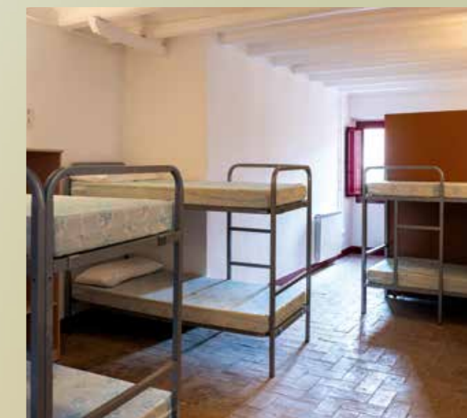
El refugi de Verdú, apte per a 32 pelegrins.