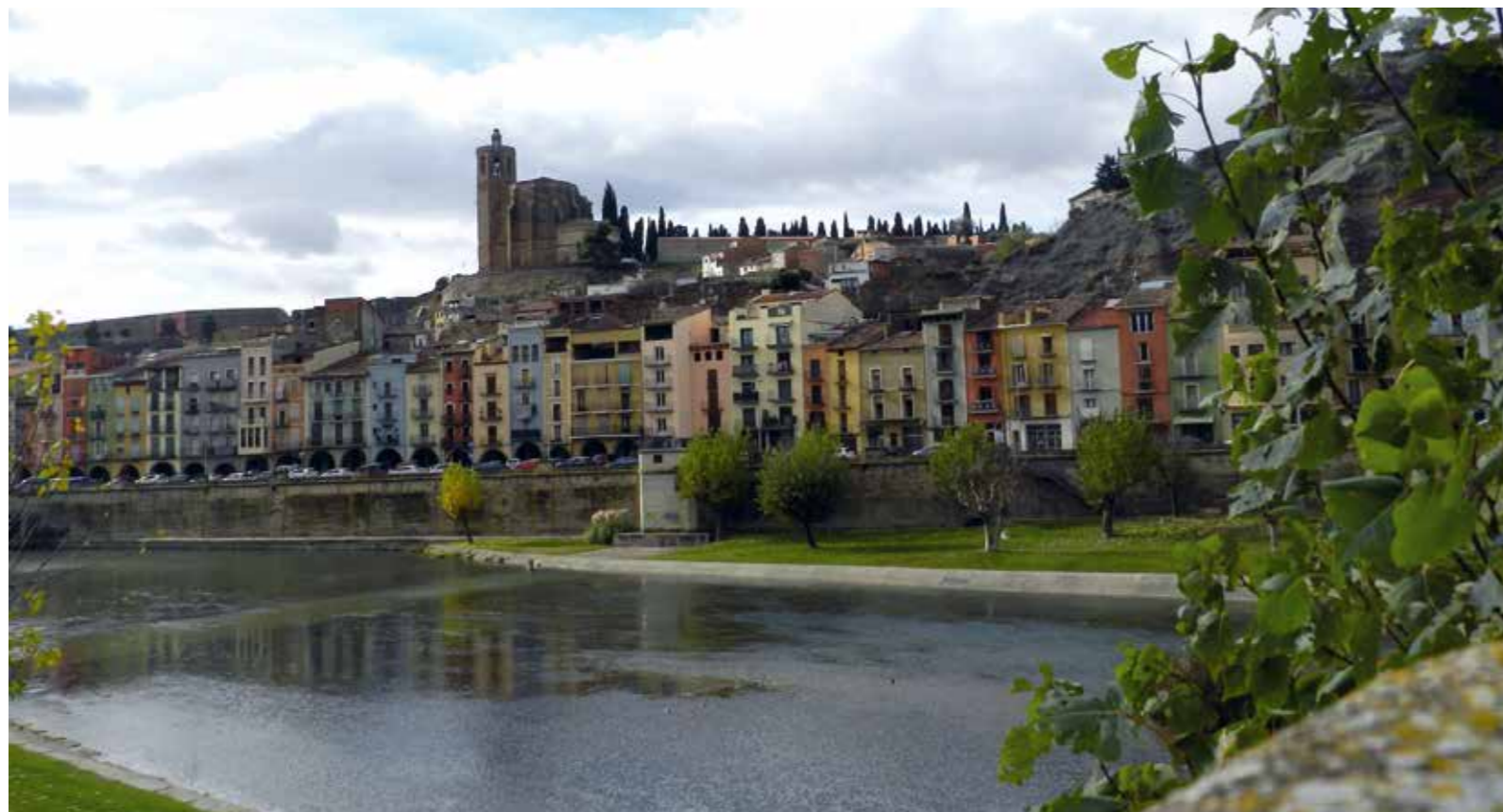
El Camí del Segre s'inicia a la vila de Llívia, a la Cerdanya, i creua els municipis de Puigcerdà, la Seu d'Urgell, Balaguer (a la foto) i va a petar a Lleida per enllaçar amb l'altre Camí Català.